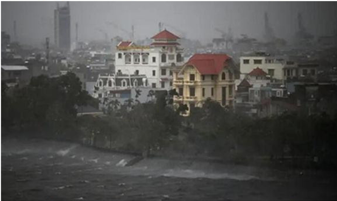
Khu vực hồ Phương Lưu, TP Hải Phòng trong bão

Dự báo trong 3 giờ tới, bão di chuyển theo hướng Tây-Tây Bắc với tốc độ 15–20km/h.