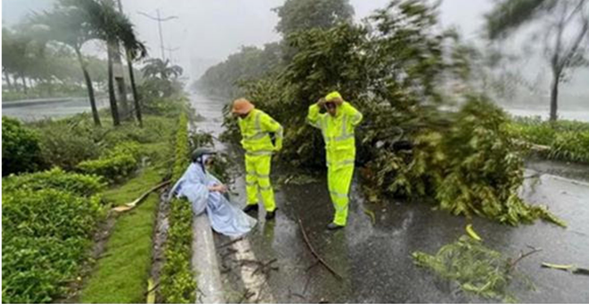
Lực lượng cứu hộ bị cây đổ ở khu vực Bãi Cháy, Quảng Ninh