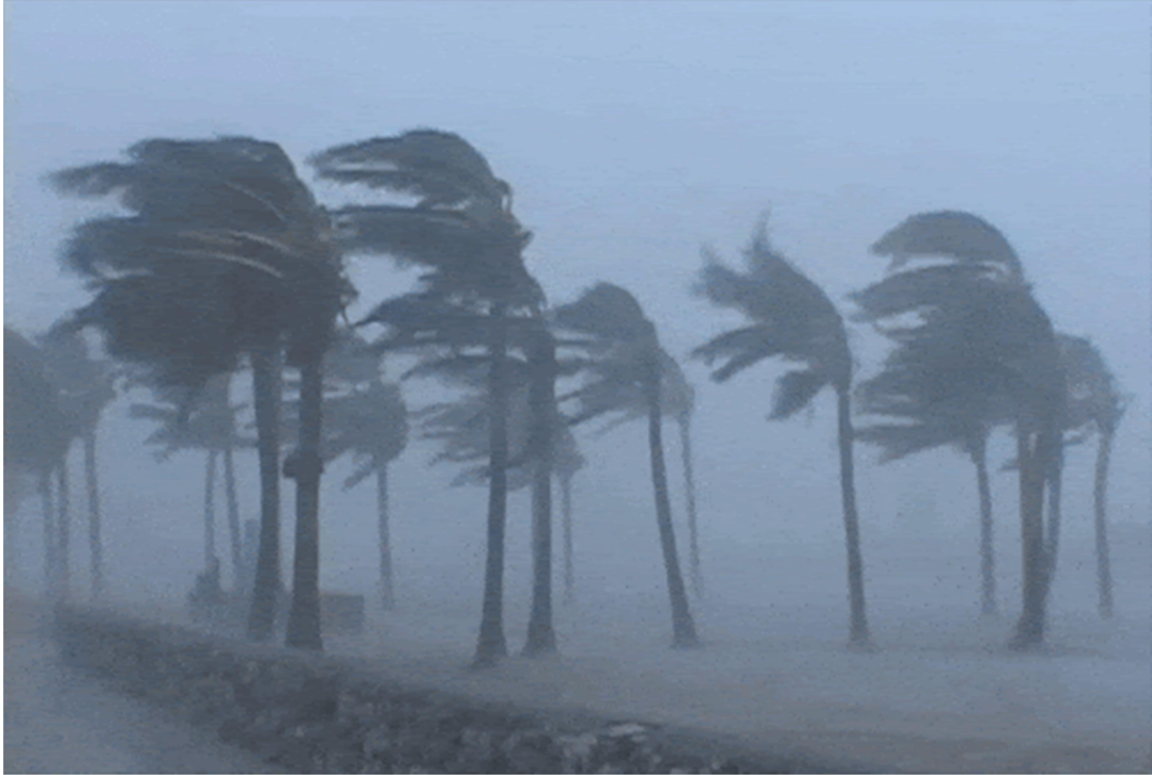
Siêu bão YAGI vào vịnh Bắc bộ