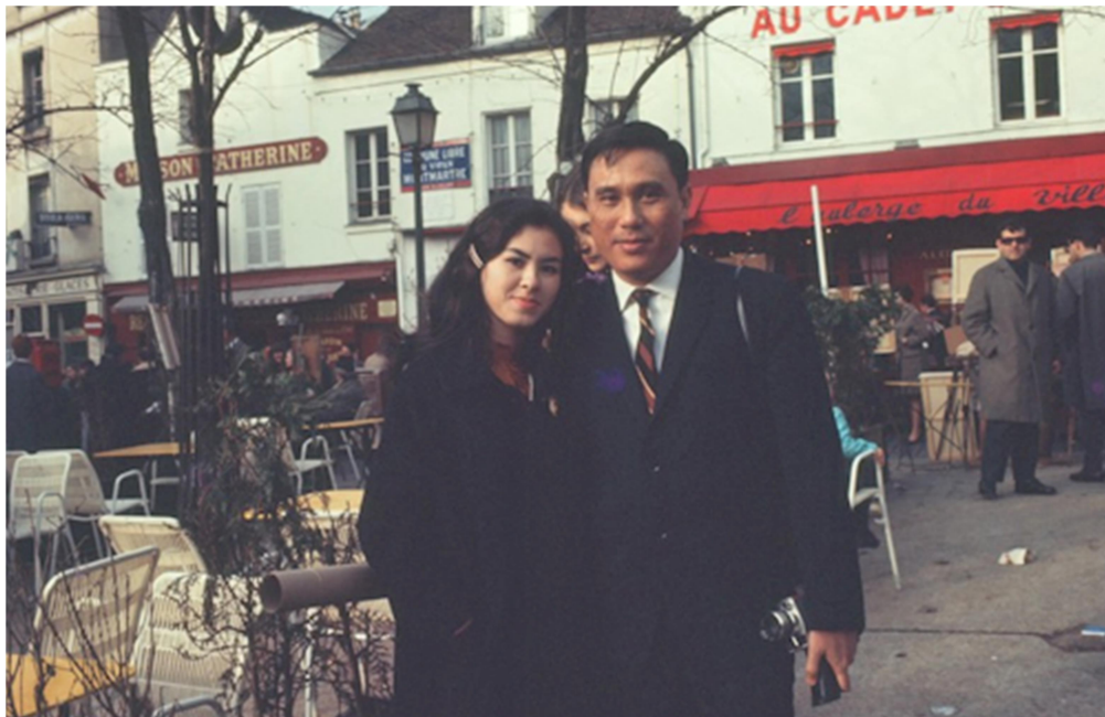
Hình 3, 4, 5 & 6: CHÚNG TÔI CHỤP TẠI PHÁP KHI NHÀ TÔI ĐI DỰ HỘI ĐÀM BA LÊ