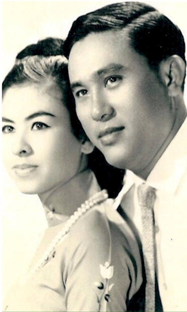
CHÚNG TÔI CHỤP TRƯỚC KHI ĐƯA NHÀ TÔI RA PHI TRƯỜNG ĐI PHÁP NĂM 1968