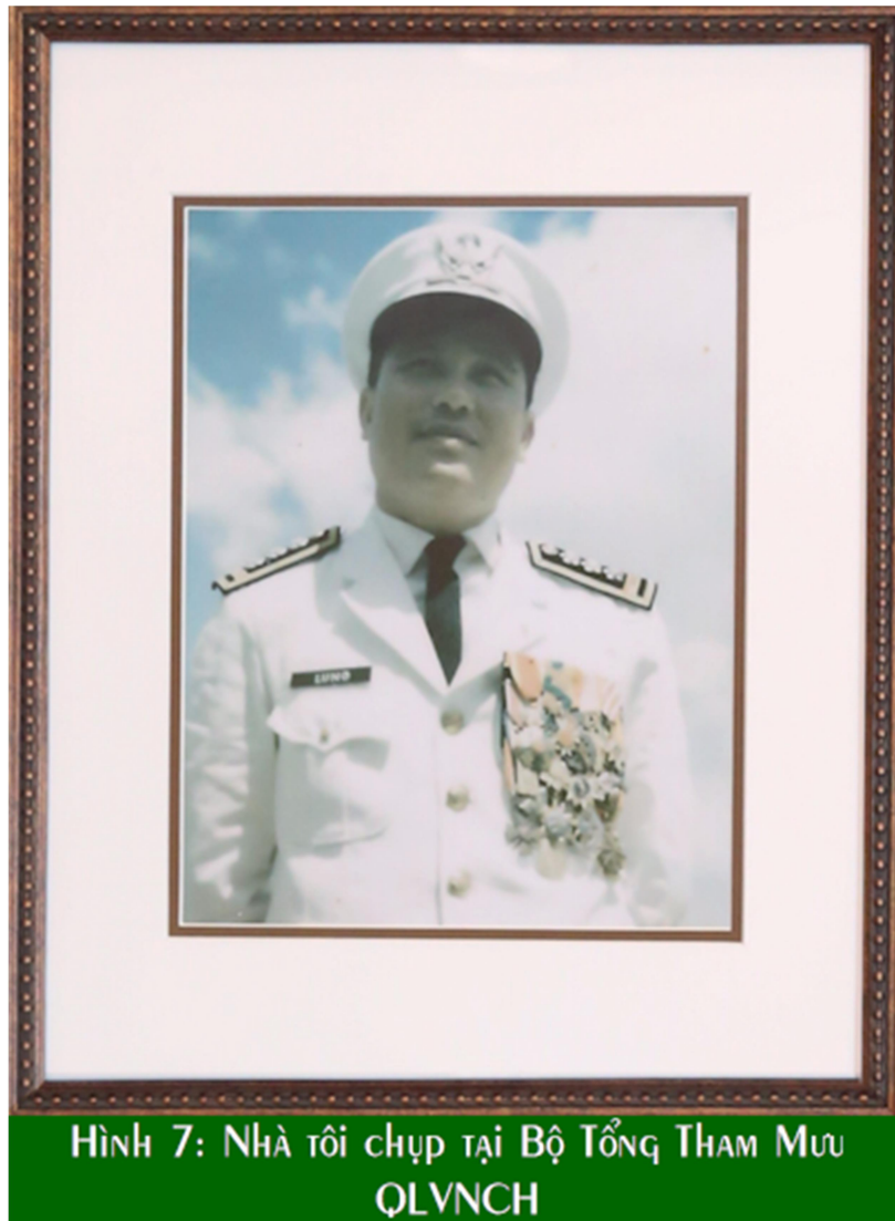
HÌNH 7: NHÀ TÔI CHỤP TẠI BỘ TỔNG THAM MƯU QLVNCH