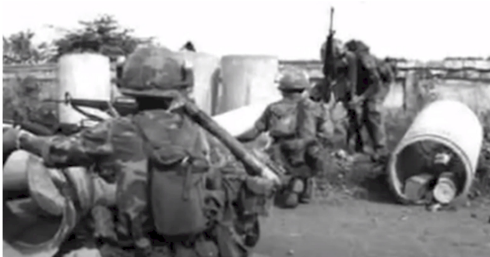
Lực lượng nhảy dù ở căn cứ Tân cảnh (hình tượng trưng)

Rải rác khắp các vùng chiến thuật biết bao nhiêu chiến sĩ Vô Danh đã anh dũng chiến đấu và hiên ngang gục ngã họ chẳng bao giờ được nhắc nhở và nếu may mắn được nhắc tới thì cũng chứa chất hàm hồ sai lạc như các chiến sĩ SĐ22BB. Gặp lại những người bạn cũ trên chiến trường này than phiền về những bất công của dư luận, nhất là một người anh nên tôi xin kể lại trận đánh có một không hai này.