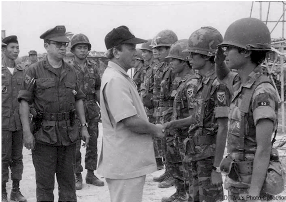
President NGUYEN VAN THIEU visits 83rd Ranger Battalion at DUC HUE camp

Tổng thống Nguyễn Văn Thiệu thăm Tiểu Đoàn 83-BĐQ tại trại biên phòng Đức Huệ