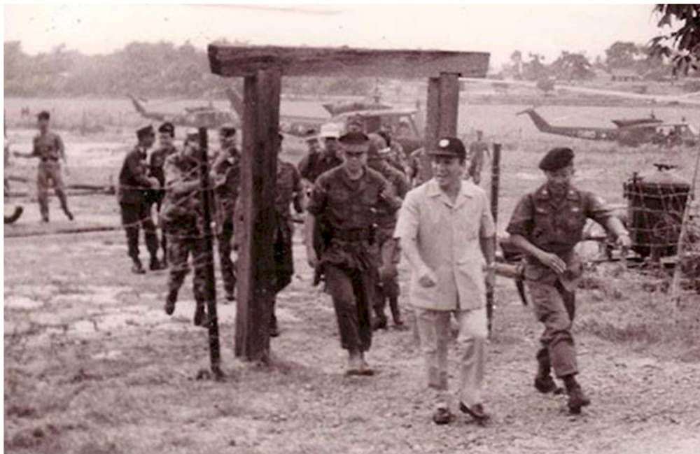
President Nguyen Van Thieu flew to Go Dau Ha to visit the troops after DUC HUE battle