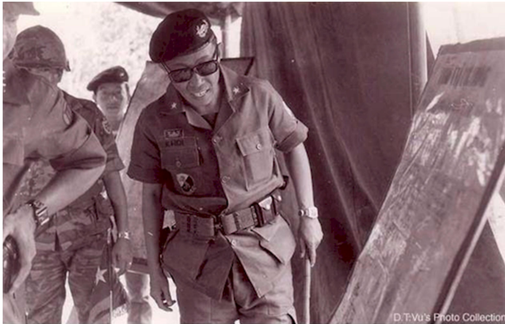
BRIGADIER GENERAL TRAN QUANG KHOI