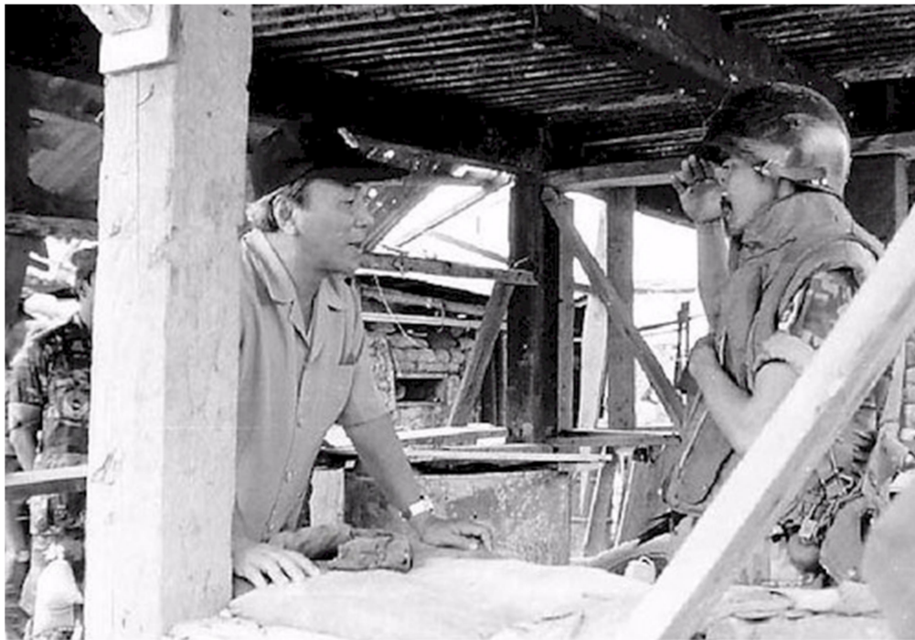
President Nguyen Van Thieu is in a pep talk with a Ranger at Duc Hue Camp

Tổng thống Nguyễn Văn Thiệu thăm Tiểu Đoàn 83-BĐQ tại trại biên phòng Đức Huệ