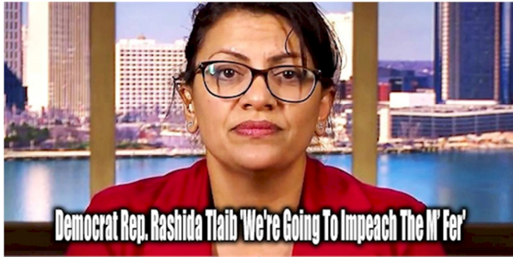
Hình: Một nữ dân biểu đảng Dân Chủ đã vô cơ có lời lẽ thuộc loại vô giáo dục, khi cô ta văng tục trước công chúng, để xúc phạm Tổng Thống Trump, một Tổng Thống hợp pháp và hợp hiến tại Hoa Kỳ

Đây là đất nước tự do dân chủ và quyền tự do ngôn luận được triệt để tôn trọng, nhưng không phải vì đó mà những ai nhận mình là công dân Mỹ có thể đứng ở vị trí kẻ thù nước Mỹ, để vô cơ tấn công Tổng Thống Mỹ bằng cách bịa đặt, vu khống ông, hầu tiếp tay kẻ gian cản trở việc làm chính đáng của ông.