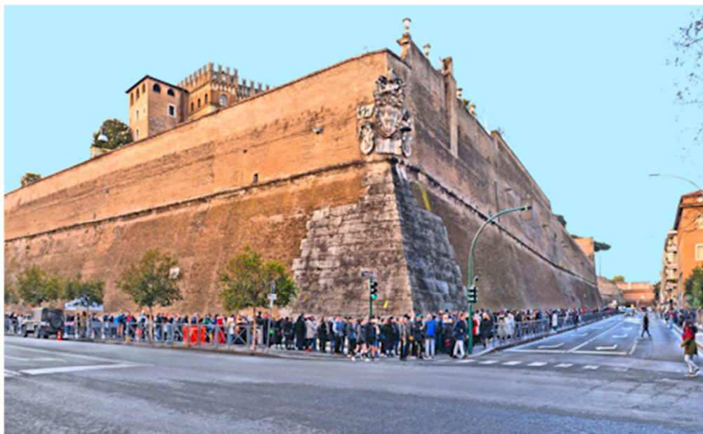
Hình: Một phần của bức tường thành bao bọc Vatican City ở Rome

Ngay cả Tòa Thánh Vatican là nơi thuộc về tôn giáo, thiêng liêng, nhưng cũng có bức tường kiên cố, cao 30 feet, cao gấp ba lần bức tường giữa Đông và Tây Bá Linh... Nhưng có ai dám cho rằng chủ trương xây tường cao như thế là phản đạo đức hay không có “tình yêu thương”?