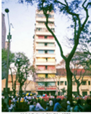
Hotel Catinat - Sài Gòn 1970.