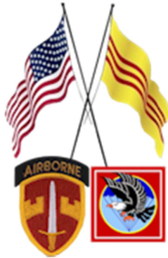
Bản Ảnh ngữ