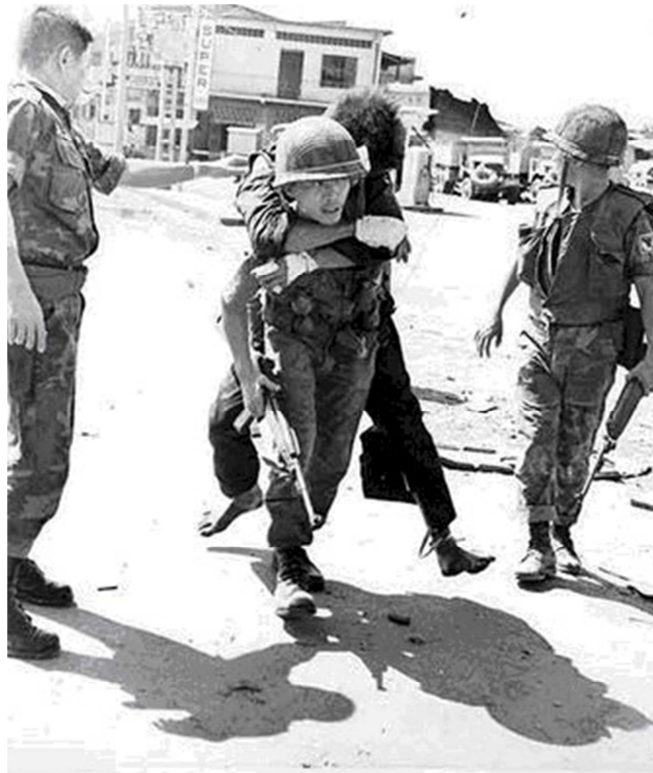
An ARVN airborne soldier carries a wounded captured NVA soldier

Trận xung phong này kết thúc với 60 Việt cộng bị hạ, 11 bị bắt sống, khoảng 100 nhà cửa của dân chúng ở ngã tư Bảy Hiền phía bên mặt đường Lê Văn Duyệt bị thiêu hủy. Cây xăng Shell cũng bị cháy và lực lượng Nhảy Dù tịch thu được 30 vũ khí đủ loại trong đó có một súng phòng không và một khẩu đại bác không giật 75ly, rất may Việt cộng chưa dùng tới. Một điều may khác là Việt cộng tới sát trường Quốc Gia Nghĩa Tử mà chưa đột nhập được vào bên trong nơi có nhiều học sinh lưu trú. Nếu Việt cộng chiếm được nơi này làm nơi cố thủ sẽ gây nhiều khó khăn cho quân đội chính phủ.