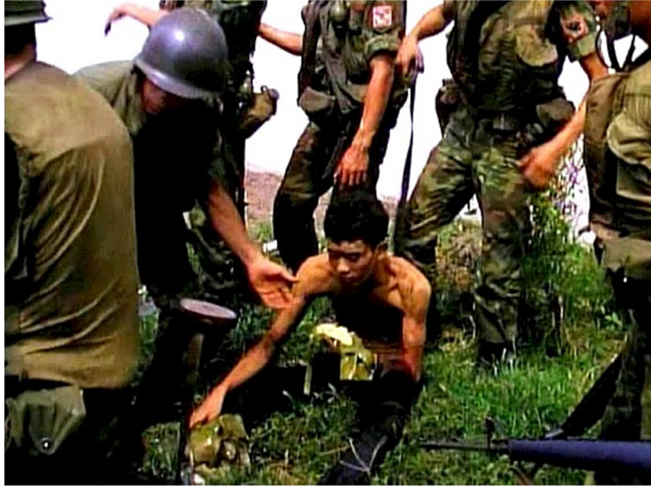
Chiến Sĩ Nhảy Dù đòi xu nham đao voi tu binh VC