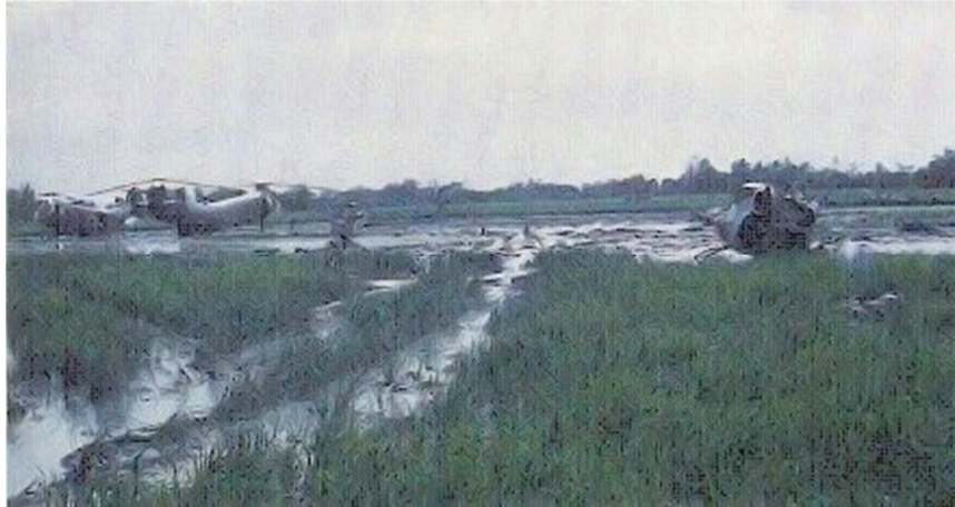
2 chiếc H-21 & HU-1A bị bắn rơi trên đồng lúa

Binh chủng Nhảy Dù hồi đó là lực lượng Tổng trừ bị duy nhất của quân đội. Chiến trận chưa đến nổi sôi bỏng như các năm về sau, hoạt động địch quân hầu hết là du kích chiến hơn là trận địa chiến. LĐND năm 1963 gồm 5 Tiểu đoàn tác chiến cùng các đơn vị tiếp vận, đảm trách nhiệm vụ “lính cứu hỏa” cho toàn quốc, mặt trận nào gay cán là được Tổng Tham Mưu gọi đi chữa cháy. Ngoại trừ những đơn vị đi hành quân xa, tại Sài Gòn hằng ngày đều có 2 Tiểu đoàn Nhảy Dù ứng trực: một Tiểu đoàn trực hành quân bộ (ground alert), với một đoàn xe GMC đậu sẵn trong doanh trại, có lệnh là lên xe đi. Một Tiểu đoàn trực hành quân không vận, được gọi là air alert: đơn vị ra nằm sẵn tại phi trường Tân Sơn Nhất, khi hữu sự thì lên máy bay đi can thiệp những nơi dầu sôi lửa bỏng. Nếu từ sáng đến chiều không có chuyện gì xảy ra, thì lính dù chỉ nằm dài bên cạnh những bộ dù được xếp ngay ngắn tại sân bay chờ lệnh.