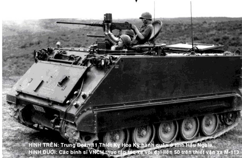
HÌNH TRÊN: Trung Đoàn 11 Thiết Kỳ Hoa Kỳ hành quân ở tỉnh Hậu Nghĩa. HÌNH DƯỚI: Các binh sĩ VNCH thực tập tác xạ với đại liên 50 trên thiết vận xa M-113.