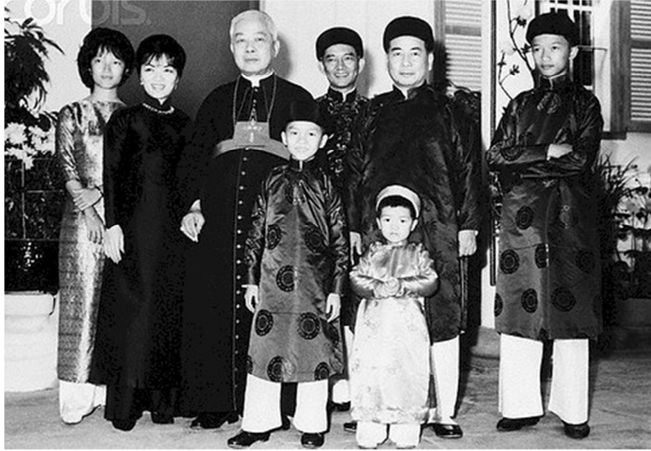
Gia đình của cố Tổng thống Ngô Đình