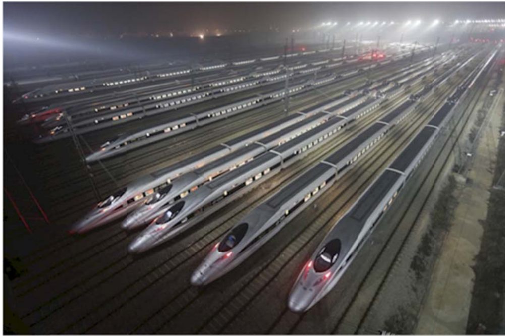
CRH380 (Hệ Thống Đường Sắt Cao Tốc) ở thành phố Vũ Hán (Wuhan, Hubei), December 25, 2012.