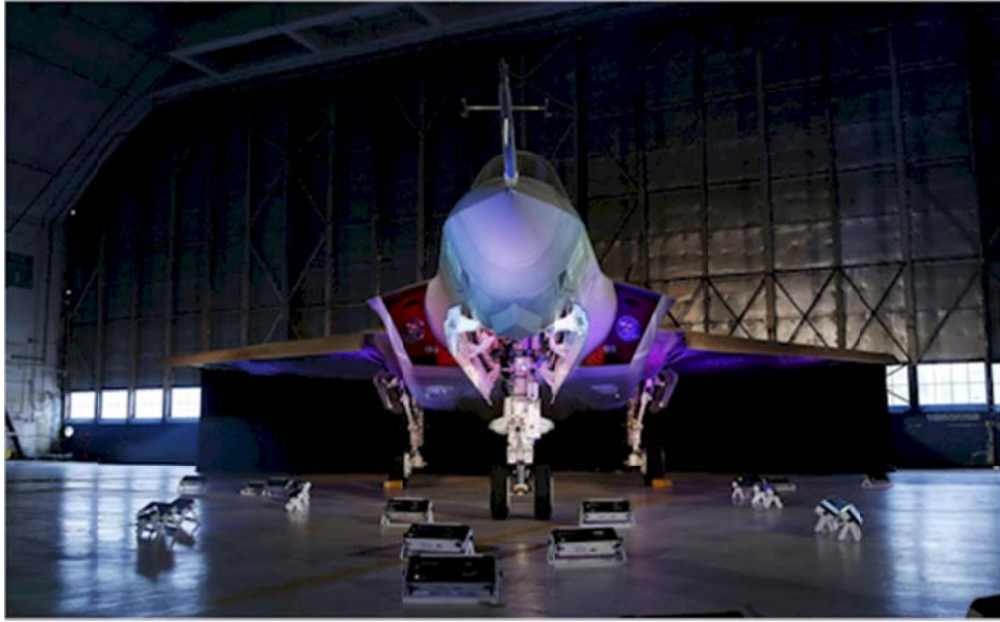
Phản lực cơ chiến đấu F-35 Lightning II của hãng Lockheed Martin

Trong trường hợp họ không thể lôi kéo các nhân viên tình báo Mỹ hoặc người trong cuộc, TC cũng tham gia vào việc tấn công mạng (tin tặc - hacking) - chẳng hạn như trong trường hợp phản lực cơ chiến đấu F-35.